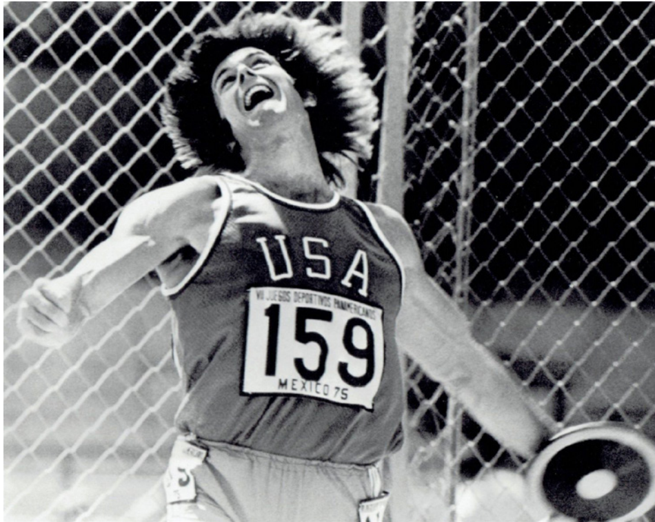
Billede 2: Bruce Jenner i diskoskast ved Pan Am Games i 1975

Caitlyn Jenner var før da kendt som Bruce Jenner, reality show celebrity i kraft af sit ægteskab med Kris Kardashian og, for denne sammenhæng vigtigt, som guldmedaljevinder fra De Olympiske Lege 1976 i Montreal, hvor Jenner slog sin egen verdensrekord i disciplinen tikamp. Problemstillingen vedrørende skam og sublimering skal have denne selvbiografi som omdrejningspunkt. 2